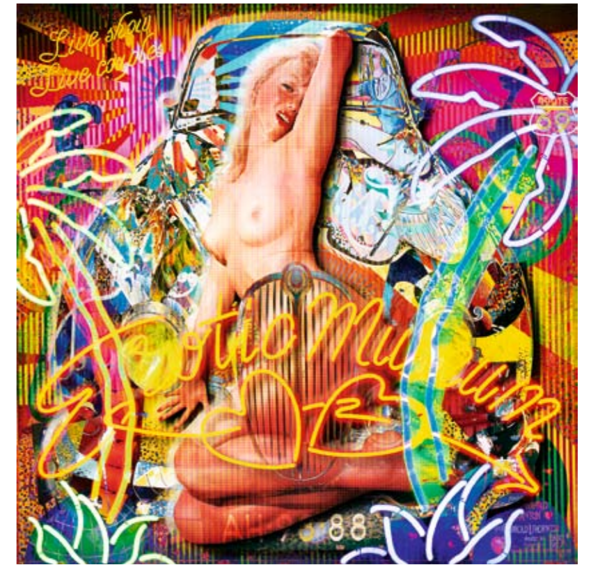
«AMSTERDAM» Une ode aux vitrines de toutes sortes de la ville libertaire.