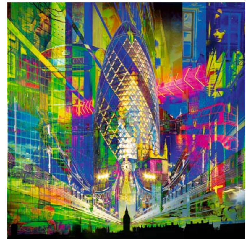
«LONDRES» Jeux de lumières autour du building Swiss Re de Norman Foster, Big Ben, les bus à étage.